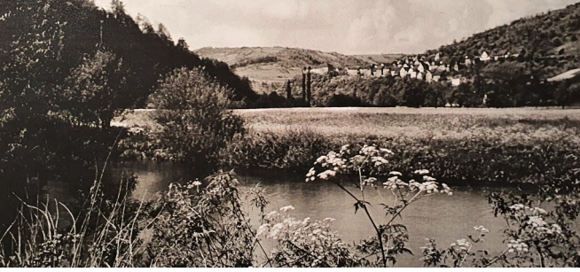
Blick vom Kocherufer bei Künzelsau über die Kocherwiesen nach Nagelsberg