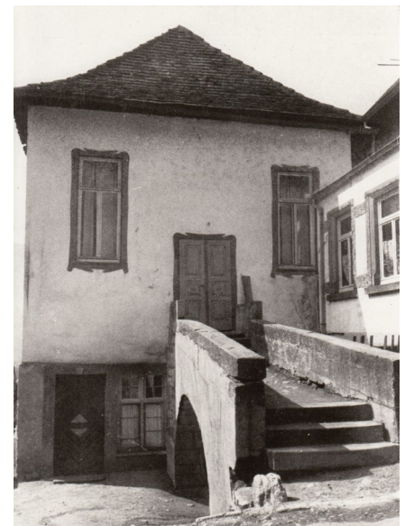
Über eine Brücke kam man in die Synagoge