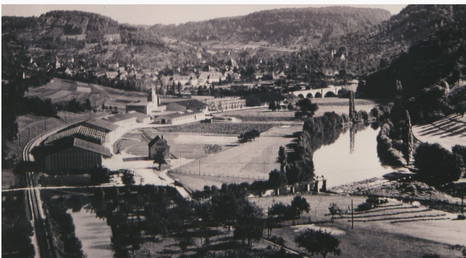
Kocherwiesen mit Flachswerk

Das Flachswerk wurde 1938 fertiggestellt. Der Platz in der Au eignete sich hervorragend: Ebenes Gelände, genügend Wasser und ein Bahnanschluss. Für viele Nagelsberger ein naher und sicherer Arbeitsplatz. Der von Bauern nach der Ernte angelieferte Flachs wurde geriffelt, die Garben in ein Röstbecken gesetzt, danach getrocknet, gebrochen, durch Kämme gezogen, um die Fasern zu gewinnen. Diese grüne Faser wurde von Spinnereien und Webereien weiter verarbeitet. 1956 wurde das jetzt unrentable Werk geschlossen.