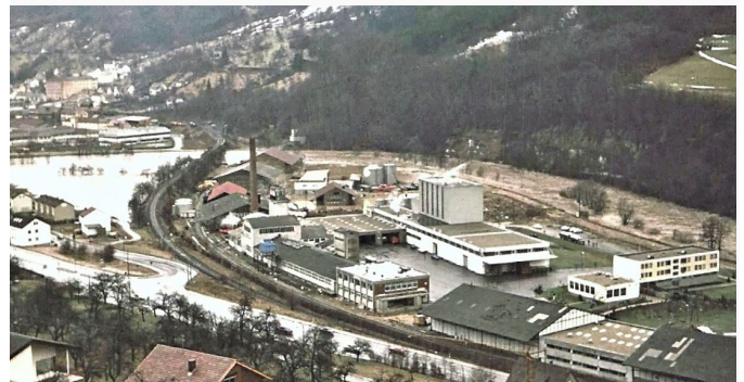
Das Milchwerkareal bei einem Winterhochwasser

Das Milchwerk nahm 1957 unter dem Namen »Dauermilchwerk Hohenlohe-Franken« seinen Betrieb in den bestehenden Gebäuden auf. Die Tagesanlieferung stieg von 34.000 kg im Jahr 1957 auf 1.350.000 kg im Jahr 1982. Aus der Rohmilch wurden Kondensmilch, Kaffeesahne, Milchpulver und Futtermittel hergestellt. Diese Produkte wurden sogar in Länder Afrikas und Arabiens exportiert. Ab 1980 firmierte der Betrieb unter »Landgold Milch GmbH Künzelsau« und hatte 1982 rund 240 Beschäftigte bei einem Umsatz von ca. 350 Mio. DM. Im Werksgelände wurde laufend in neue Produktionsanlagen investiert. Das Werk gehörte ab 1989 der »Südmilch AG«. Nach der Wende engagierte sich diese 1992 bei der Sachsenmilch AG. Fehler des Managements führten zum finanziellen Niedergang, bekannt geworden als Südmilch-Skandal. Die insolvente Südmilch AG wurde von Campina aus Holland übernommen und der Betrieb in Künzelsau 1993 eingestellt. Viele Jahre standen die Gebäude nun leer.