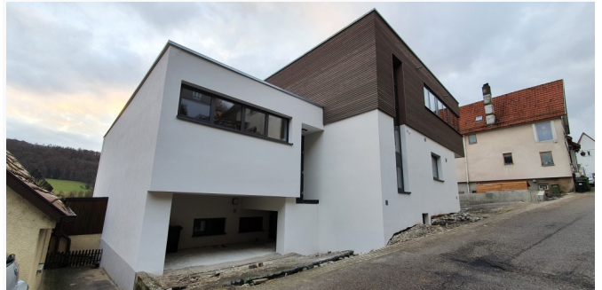
Nun fertig: Das neue Dorfgemeinschaftshaus

2022 wird das neue Dorfgemeinschaftshaus eröffnet. Es dient nun den Nagelsbergern als Zentrum ihres Stadtteillebens.