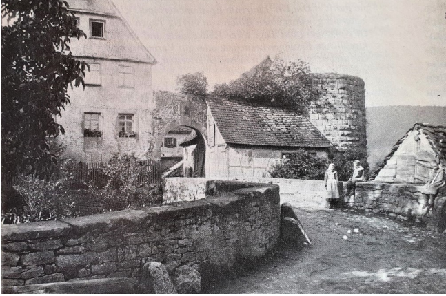
Burg Nagelsberg, vor 100 Jahren | mit Fernblick ins Kochertal bis nach Criesbach und nach Künzelsau